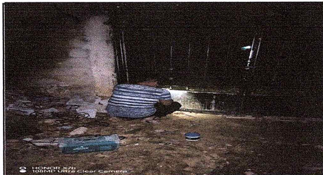
Foto 3: LA SUSTITUCIÓN DEL PORTÓN No. 2 QUE SE ENCUENTRA UBICADA EN LA PARTE DE ATRÁS DE LA ESCUELA PEGADA A LA COCINA.