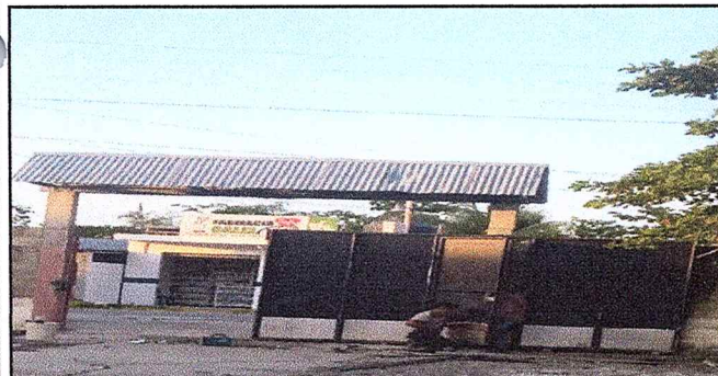
Foto 5: REPARACIÓN DEL PORTÓN No. 1 ENTRADA PRONCPAL DE LA ESCUELA EORM. ALDEA PLAYITAS.