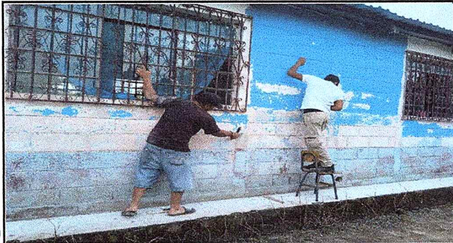
Foto1: LIMPIEZA DEL LA PINTURA DEL CENTRO EDUCATIVO