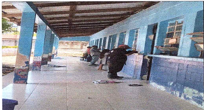
Foto 4: RASPADO DE LA PARED DE LA ESCUELA PREVIO A REALIZAR LA PINTADA POR DENTRO Y FUERA DE LAS AULAS